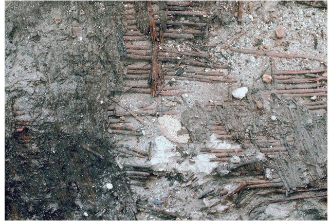
11 H'-44区アンペラ検出状況