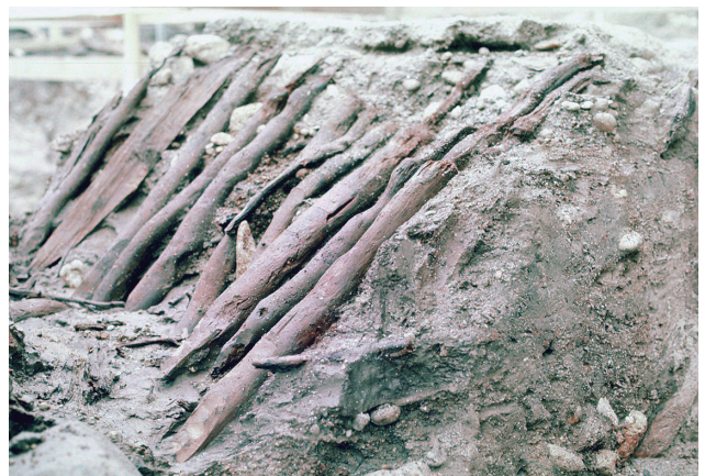
7 木杭列（護岸）検出状況