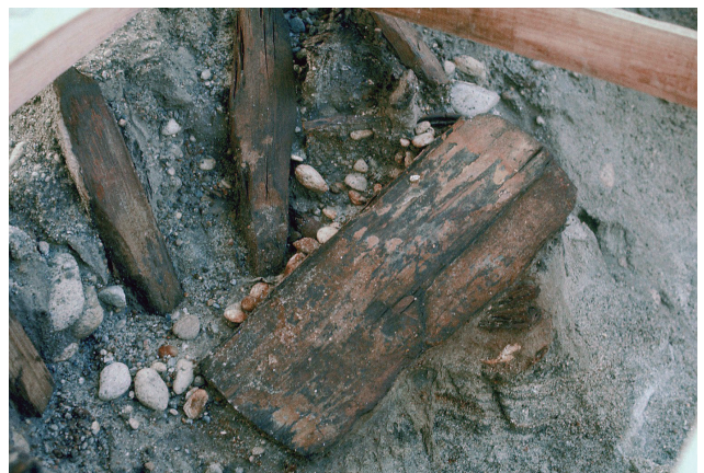
9 J'-45 区板状製品（矢板）検出状況