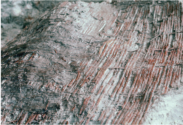
10 アンペラ検出状況