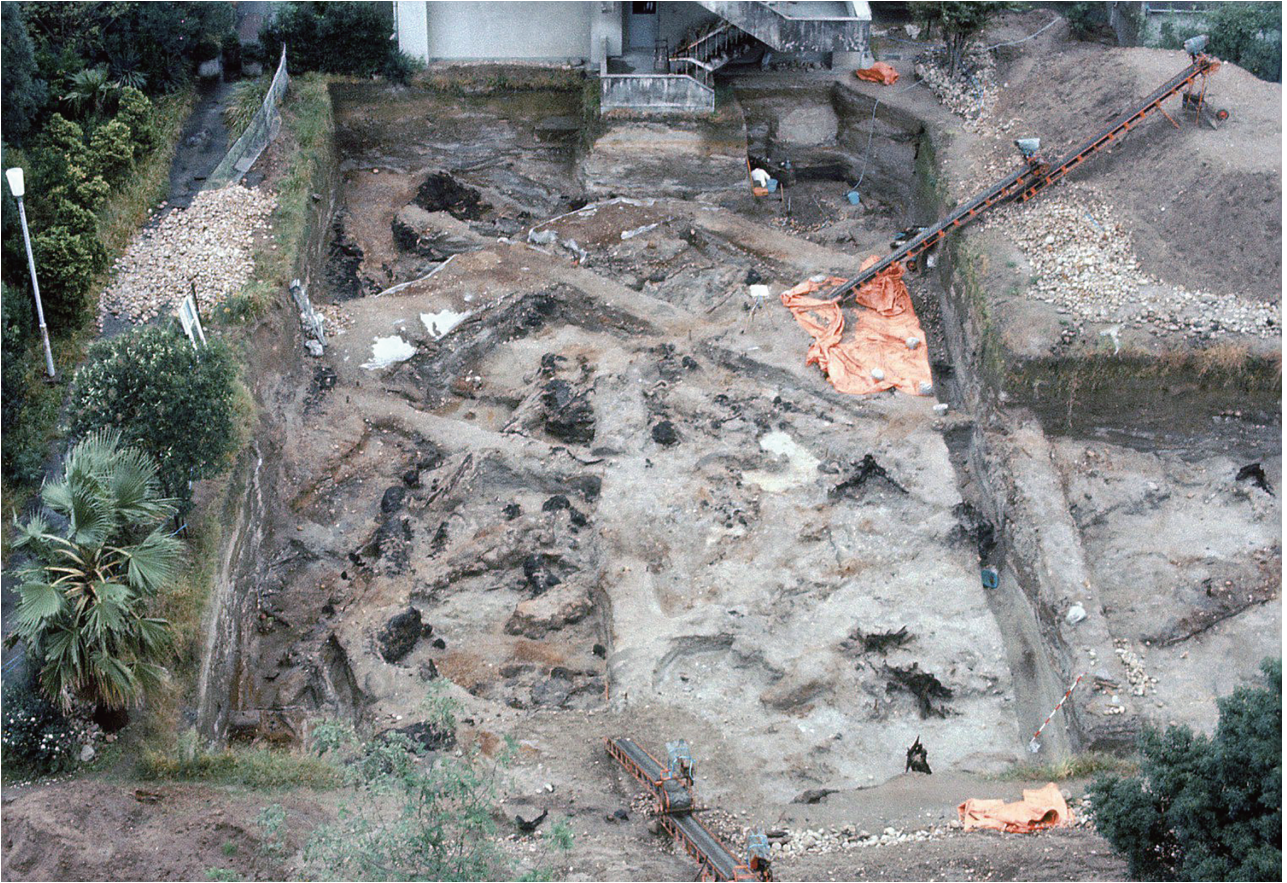
1 河川跡調査状況（西より）