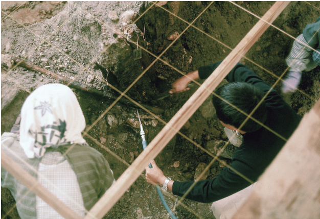
19 木杭列（護岸）調査風景