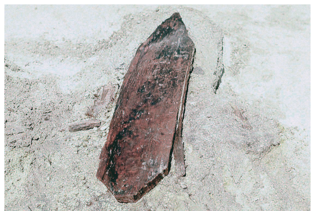
17 G'・H'-48区八角板状製品(矢板)出土状況