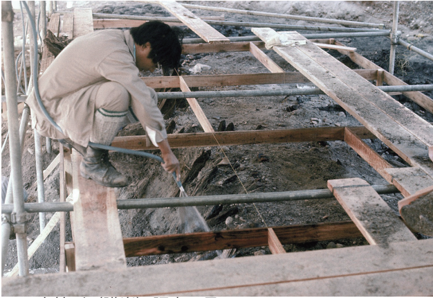
18 木杭列（護岸）調査風景