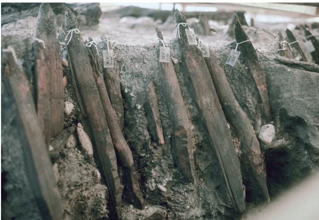
6 木杭列（護岸）検出状況