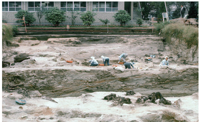
3 河川跡内土層（北より）