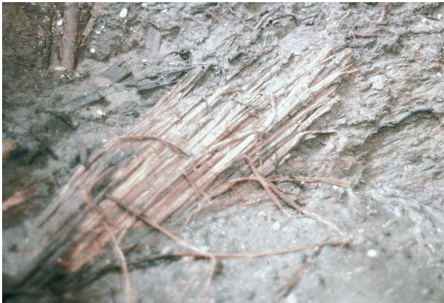
12 木杭列内の植物繊維検出状況