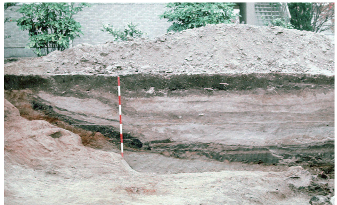
4 B'-49区南壁西側土層（住居跡に切られる河川跡）