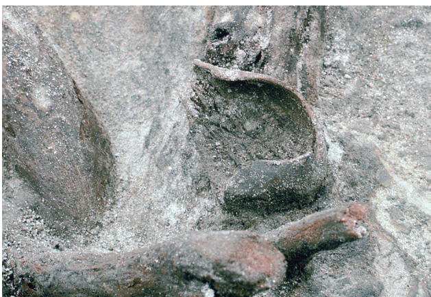
16 I'-47区ヒョウタン出土状況