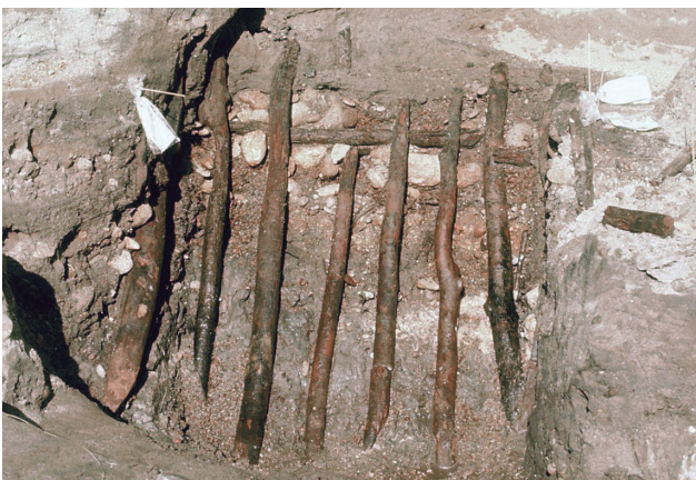
8 木杭列（護岸）検出状況