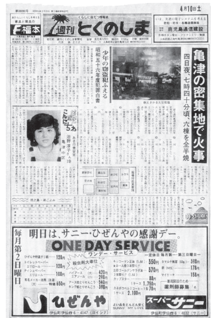
写真3 『週刊とくのしま』 1982年4月10日号