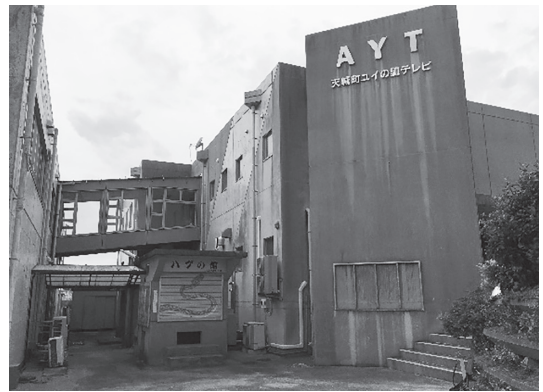
写真1 天城町役場（左）とつながるユイの里テレビ

せっかくのテレビ局。一つの町のものではなく、徳之島全体のメディアになればいい。そんな考えを吐露した徳之島町議もいたようだ。平成の大合併時、3町合併が実現していたら「島のテレビ」に衣替えしていたことになる。