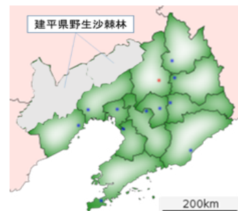
図1 建平県野生沙棘の分布

野生沙棘の供給が需要に追いつかない状態であるため、目先の利益を追求する農家が沙棘の生育の環境整備や生育管理を重視せずに、沙棘の果実を無計画に過剰収穫した結果、沙棘樹体にダメージを与えてきた。さらに、林間放牧が無秩序に行われ、それが沙棘の破壊をもたらしてきたということである。