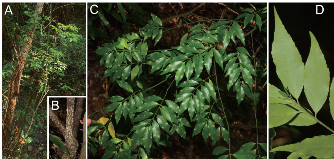
図1. リュウキュウマユミ Euonymus lutchuensis T. Itô. A: habit; B: bark; C: leafy branches; D: lower leaf surface. All photos taken in Shimo-koshikishima Island on 13 Oct. 2020.