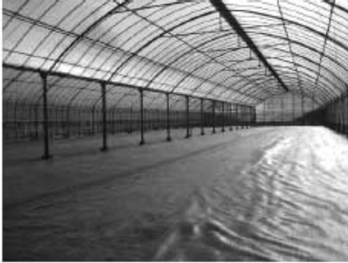
第1回 ハウス改修後