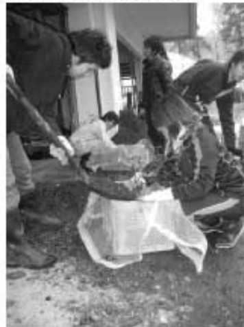
第4回 コンテナへの定植