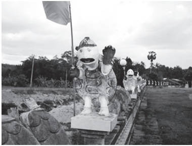
[写真79. シンボルの亀がいたるところにある]