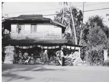
[写真76. 寺の前のマレー人商店]