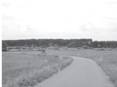
[写真100. 水田の中の小道を行くバイク]

インターネット用のパソコンなどもあり，若い僧侶が意欲的な活動をしている様子がみてとれた。講堂内部がこのように整えられたのは2004年からであるらしい。ポスターに華語がみられるが，華人の訪れはほとんどないと思われる。全体としてシャム人だけの孤立集落の印象が強く，バイクで通行可能なあぜ道を通って，南のWat Peduと繋がる抜け道がある。