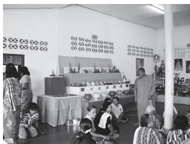
[写真103. 誕生色の寄付鉢]