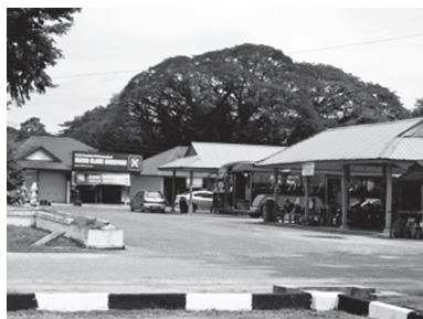
[写真66. Sikバスステーション]

地域の特徴：西側にBkt.Perakがあり、東の山岳はタイ国境と接する。南はバリン郡に接する。タイ国境近くのムダ川の源流地域は堰止のダムになっており、水源保全林である。東南部西南部もそれぞれ保全林のある山に接している。丘陵というより山間というイメージの土地である。2000年以降、北西部を接するパダントラップ郡に抜ける道路を大拡張し、同じくタイと国境を接するパダントラップ郡のドリアンブルン国境（Kota Putra）を再開する計画が進行中で（予定では2010年5月）、大規模な開発工事が行われており、ほんの5年前とも景観は大幅に変わりつつある。一番目に付くのが道路の二倍拡張と交差点整備で、特に、クダー中央部を東西に横断する Gurun-Jeniang-Sik の拡張道路はこの地域の景観と交通網を全く変えてしまっている。