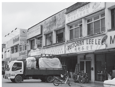
[写真108. 市街の車修理屋 センター]