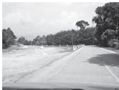
[写真67. 景観を変える道路拡張]