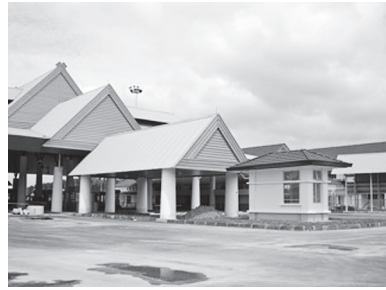
[写真93. 新国境Kota Putra 2009]