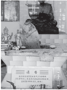
[写真106. 土地神と 寄付像]