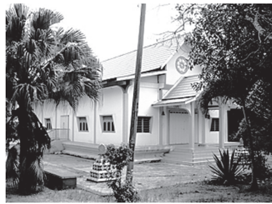
[写真83. 本堂とタイル張りのセーマー]