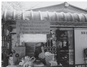
[写真72. 僧侶オフィス]