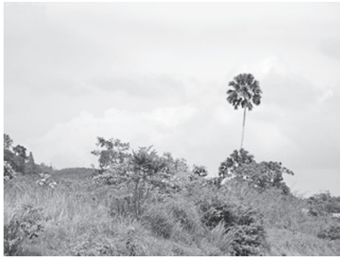
[写真92. 旧ドリアンブルン村の 廃墟]