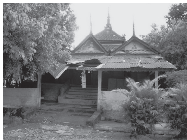
[写真78. 昔の木造本堂]