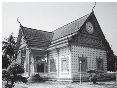
[写真77. タイ様式の本堂]

亀のシンボルが溢れており，寺を囲っているコンクリートの塀の上にも数メートルごとに亀の立像，ひょうきんな表情をしたものも含む，が並べられており，「亀寺」として有名である。なお，クダーの十二支，特にムスリムの十二支ではブタの代わりにクラ〔陸亀〕が置き換えられていることもあり，クダーにとって亀は親しみやすい動物でもある。