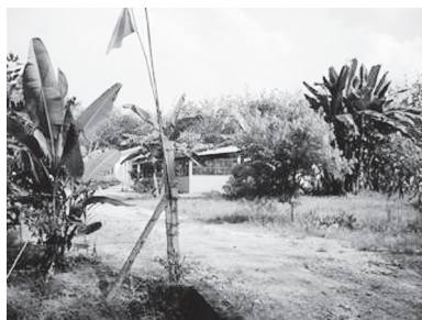
[写真90. バナナ園の中での寺全景]