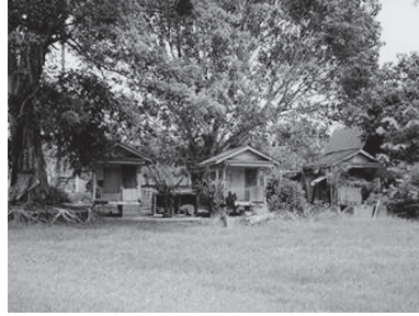
[写真107. 一時出家者のための 小屋]