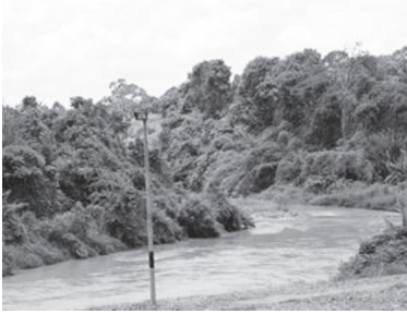
[写真70. 寺院に接するムダ川]