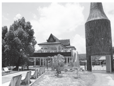
[写真73. ビール瓶で作られた仏塔と講堂]