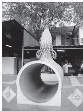
[写真112. 福建の招福パイナップル]