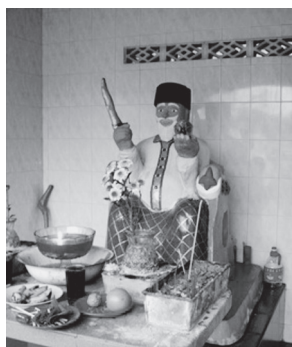
[写真114. ダトクラ マツト像]