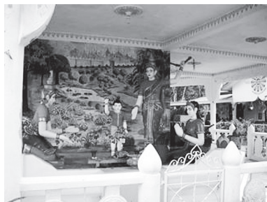
[写真85. 釈迦の一生パノラマ像]