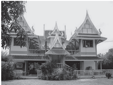
[写真104. 独特のデザインの庫裡]

2010年2月の訪問時には、新しい庫裡の建設が始まっており、訪問者に瓦代金の寄付をつる設備があった。建設に従事しているのはタイからきた労働者二名。