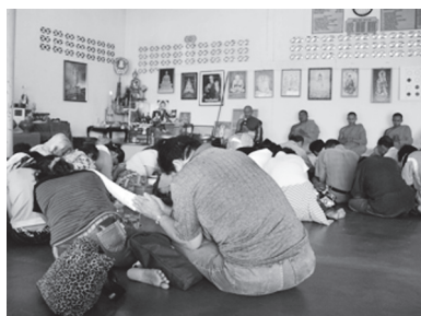
[写真102. 僧侶の読経中体をふれあう村人]