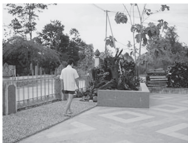
〔写真118. 足つば刺激用の砂利小道をあるく華人〕