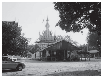
[写真75. 建築中礼拝堂]