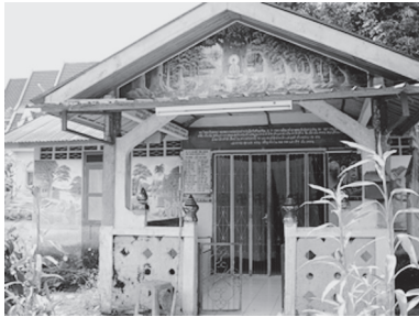
[写真88. 庫裡と食事当番表]

インタビューした僧侶41才は22才のときに出家し、水晶を体内に感じる瞑想法を教えている。英語もまた流暢で尋ねてくる華人にも瞑想法を教えている。