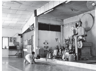
[写真105. 本堂内部、 礼拝する親子]