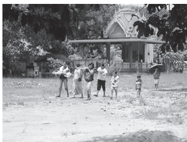
[写真99. タンブンにくる人々]