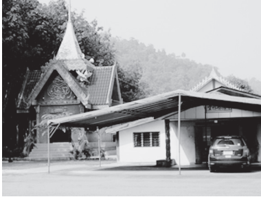
[写真80. タイナンバーの車が来ている]

評判が高いので、シンガポールからもインド系、華人系の来訪者があるからであるという。寄付者の名前のリストがあったが、ほぼ全員が華人名である。