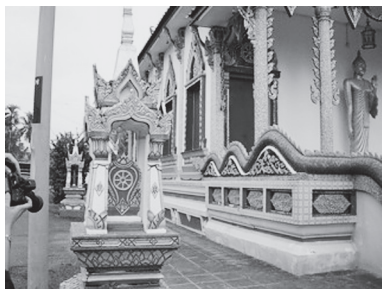
[写真113. 本堂とセーマー]