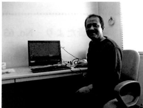
Zoarder Faruque Ahmed 教授