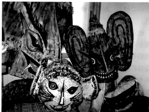
保存された八朔踊り仮面の一部

節限定で新冷凍技術導入に対し費用に耐え得る規模にはない。水産では出荷規模・週3便・市場への近接性に課題がある。光明は新船導入次世代と3島連携力にある。交流は自治会・学校連携での相互島訪問交歓・ジャンベ（西アフリカ打楽器）学童演奏で定常化しつつある。便も枕崎便が試行されている。新技術は黒島のスマートグリッド導入などで馴染みにもなりつつある。[次世代]未就学年齢児童男2女3名、小中学生13名うち「しおかぜ留学」6名という数は、必ずしも限界集落的状況ではない。教師の子供数も割り引くと、しおかぜ留学（平成13-20年実績102名・年平均13名）がない島の未来は不安感の源泉である。Iターン就労に行政・村落・島間支援が欠かせない。島外も含めた支援ネット形成に期待したい。子どもへの授業での伝統文化活動はなく（黒島は取り上げていた）若手への文化継承も（死滅しつつある古謡の唯一継承者とされる方の古い録音テープもかびっていて存命中の要採録・記録化等）課題を抱えていた。[文化基盤]八朔踊り仮面など保存箇所確認。馬方踊りも聖大名神社で230年近く継承されている。同神社の一對唐猫は文化財的価値があり、廃仏毀釈を免れた美しい釈迦像も別箇所での保存を確認した。また水神・地神・山神も大切にされており、初山初磯や平家伝承芸能・行事も存続している。しかし体系的保存記録化措置なしでは早晚保持困難になる。