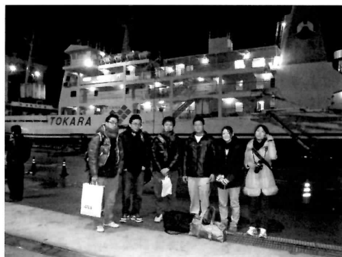
中之島実習（フェリーとしまの前にて）

島嶼学概論Ⅱの授業の一環で、修士課程の学生とともに十島村中之島へいきました。鹿児島島の離島で教員になりたいと考えている学生は、中之島小中学校の校長・教頭先生に直接お話を伺うことができました。また、アセロラやダイジョなど自分たちの研究材料を中之島で見つけて喜ぶ学生を見て、本当にうれしく思いました。机上だけではなく実地で学ぶことの大切さを今後も学生に伝えていきたいと思います。（山本宗立）