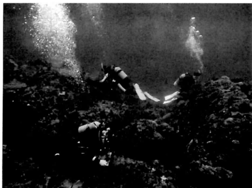
竹島港沖における調査風景(2011年5月10日)