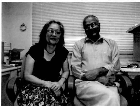
Wadan Lal Narsey 教授 (右) と奥様 (左)

平成 24 年 1 月 1 日付で河合溪准教授が教授に就任しました。また、外国人客員教授として南太平洋大学より Wadan Lal Narsey 氏、バングラデシュ農科大学より Zoarder Faruque Ahmed 氏が着任しました。Wadan Lal Narsey 教授の招聘期間は平成 23 年 5 月 9 日～平成 23 年 11 月 26 日で、専門は経済学、研究テーマは「フィジー、ツバル、ソロモン、およびバヌアツに関する定量的貧困分析」です。Zoarder Faruque Ahmed 教授の招聘期間は平成 23 年 12 月 9 日～平成 24 年 3 月末で、専門は魚類生物学、研究テーマは「日本の南方島嶼における生態系モデルに基づいた持続可能な開発と商用の魚種の管理」です。