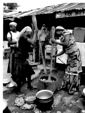
ヤムイモの調理風景