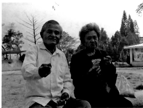
檳榔を勧めるお父さん（台湾南部）

ミクロネシア連邦チューク州では、島の人びとは生の檳榔種子、生のキンマの葉、石灰の粉を店で購入していた。意外と高価だった。生の果実を噛んで2つに割り、石灰を乗せて（あるいは水で溶いた石灰をつけて）、キンマの葉で包んで噛む。人によっては煙草の葉を加えていた。やっぱりここでも勧められたので、一応噛んでみた。すると、日本から来た外国人が檳榔を噛んでいる！大丈夫か？！酔ってないか？なぜ噛み方を知っているんだ！とみんな大喜び。おかげで心の距離が縮まり、調査がうまくいった。しかし注意をしなければならないのは石灰の量だ。石灰が口の中に直接触れると、その部分が爛れて痛い。口の中・舌・喉の入り口が痛くて、2～3日間食事をするのに苦労した・・・。