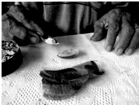
石灰・檳榔・キンマの葉（ミクロネシア）