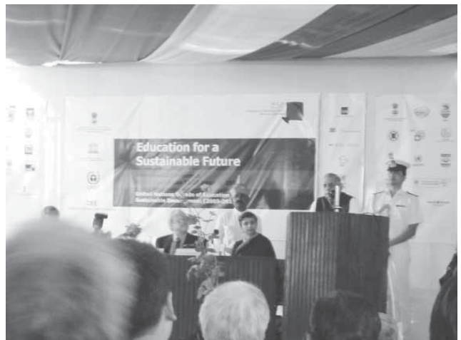
全体会 1 の様子。登壇者はグジュラードの知事