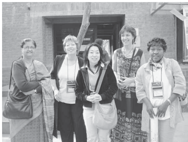
ワークショップのメンバー