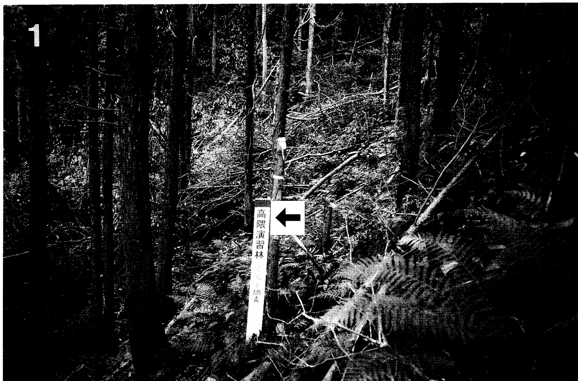
写真1, 間伐後の林相 標柱(矢印)円形プロットの中心を示す