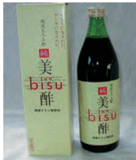
写真1 黒糖もろみ酢（美酢）