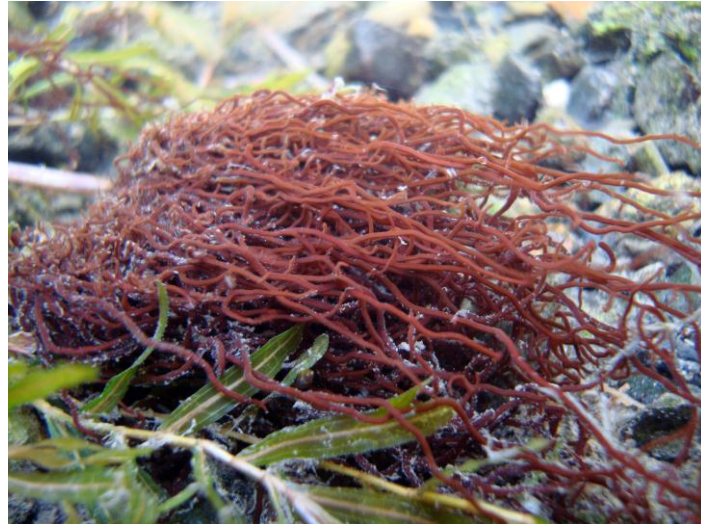
図3. 豪雨災害後の調査で確認された淡水紅藻オキチモズク (2011年2月25日, 鹿児島県大島郡龍郷町大勝).