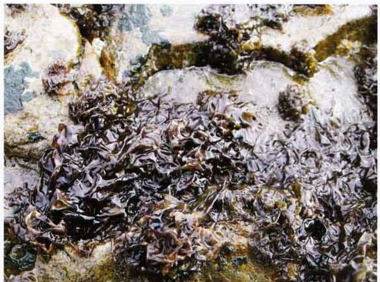
図1：タネガシマアマノリ＝西之表市伊関

昭和初期の食生活をまとめた「日本の食生活全集全50巻（農文協）」には約50種類の海藻が記されているが、現在では採取されていない種類も多い。鹿児島県は全国的に見ても海藻の種類が多く、各地でさまざまな海藻を利用してきた。本県の有用海藻をまとめた新村・田中（2007, 2008a, b）は、県内で利用されてきた海藻を63種報告しているが、現在採取されているのは自家消費を含めて30種前後であり、産業規模で採取されているのはアマノリ類（海苔）、ワカメ、ヒジキ、ヒトエグサ（あおさ・青のり）、オキナワモズク、トサカノリに限られる。例えば、種子島には島の名前を種名に持つ「タネガシマアマノリ（地方名：秋のり）」という岩海苔が生育し、古くから汁物の具として利用されていた（図1）。鹿児島県水産試験場（1913）の報告書には西之表市伊関地区だけで約300kgの生産があったとされるが、現在では一部の住民の自家用に留まっている。