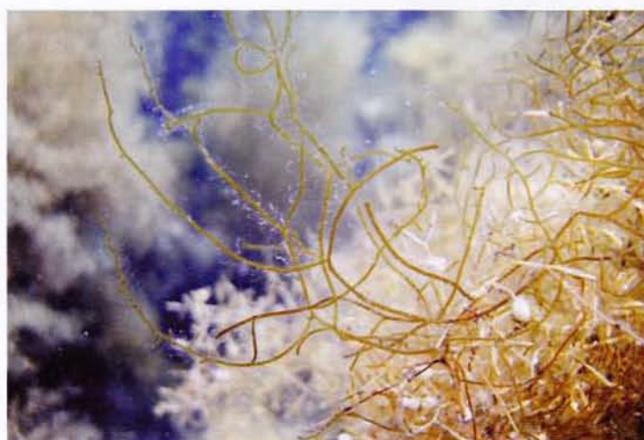
図3：「藻（ヤツマタモク）につく」モズク = 錦江町大根占