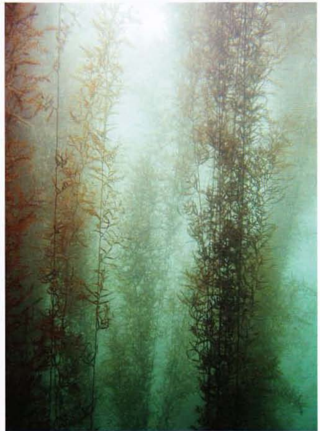
図8：アカモクの大群落＝熊本県上天草市

近年、海藻を含む藻類が新たな資源としていくつか注目されている。ひとつはバイオエタノールとしての利用であり、日本ではアカモクなどの大型海藻の利用が模索されている。バイオエタノールは、トウモロコシなどの農作物からつくられており、ブラジルなどで普及しつつある。しかし、農作物の利用は食用資源の高騰を招く恐れがあり、微細藻類や海藻などの非農作物の利用が注目されている。また、藻類から炭化水素（油）を取り出す研究も進んでいる。沖縄のマングローブ林や汽水域に生育するオーランチオキトリウム（ラビンチュラ的一种）は葉緑体を持たない特殊な従属栄養生物だが、高い増殖速度で有機物を取り込み、炭化水素を産生する。これらの研究は海藻・藻類をエネルギー源と捉える点で画期的であり、我々の社会自体を変える可能性を秘めている。しかし、いずれも試験研究段階であり、民間の投資も国際的な