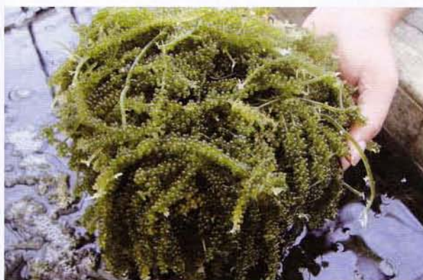
図6：海ぶどうの陸上養殖 = 奄美市