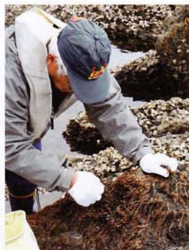
図2：岩海苔の摘み取り = 南さつま市坊津町

沖縄県で養殖される種類はオキナワモズクという熱帯性種であり、鹿児島県本土以北に見られるモズクとは別の種類である。オキナワモズクは奄美や沖縄の島嶼域で採取され、各地域で消費されていた。オキナワモズク養殖は、