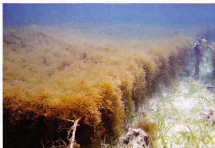
図4：サンゴ礁リーフ内でおこなわれるオキナワモズク養殖 = 沖縄県本部町