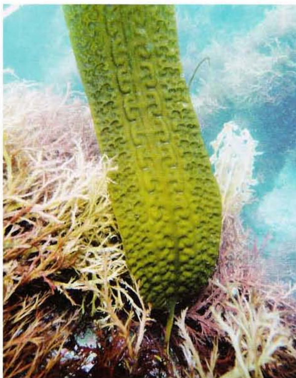
図7：ガゴメコンブ = 北海道室蘭市