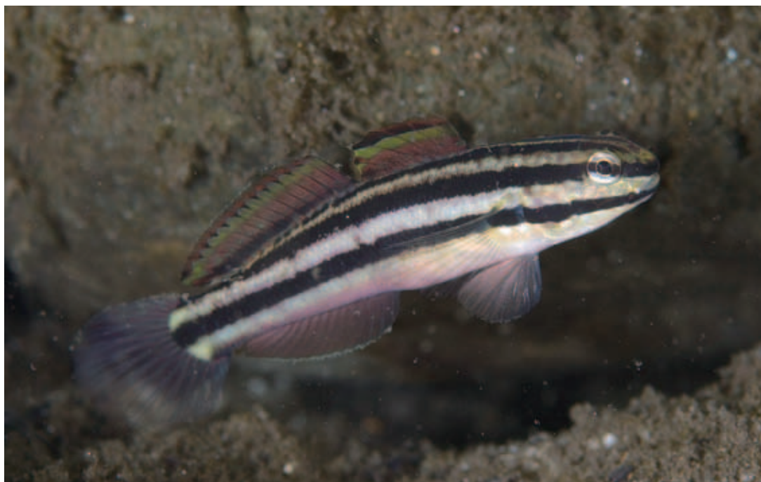
Fig. 2. Underwater photograph of Amblygobius linki . Mouth of Ambo River, Ambo, Yaku-shima Island, Kagoshima, Japan, 3 m depth, 8 Nov. 2008, water temperature 24–25°C (specimen not collected).