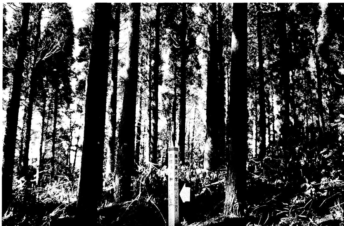
写真-1, 2. 除伐実行前(写真-1)と実行後(写真-2) 矢印は円形プロットを示す。