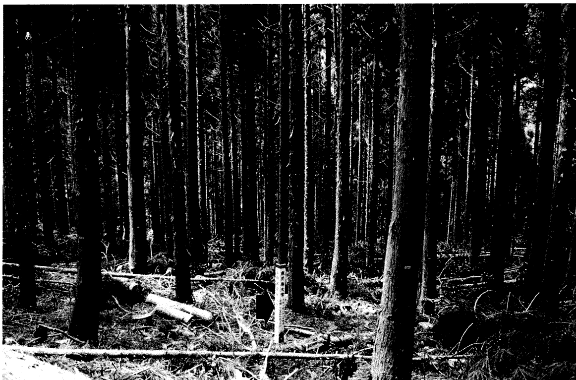
写真-1, 2. 除伐実行前(写真-1)と実行後(写真-2)の林相。 矢印は円形プロットを中心を示す。