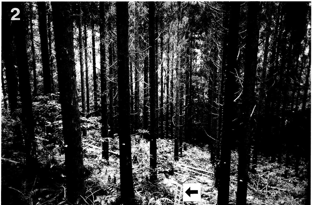
写真1, 2 間伐前(上)と間伐後(下)の林相 標柱(矢印)円形プロットの中心を示す