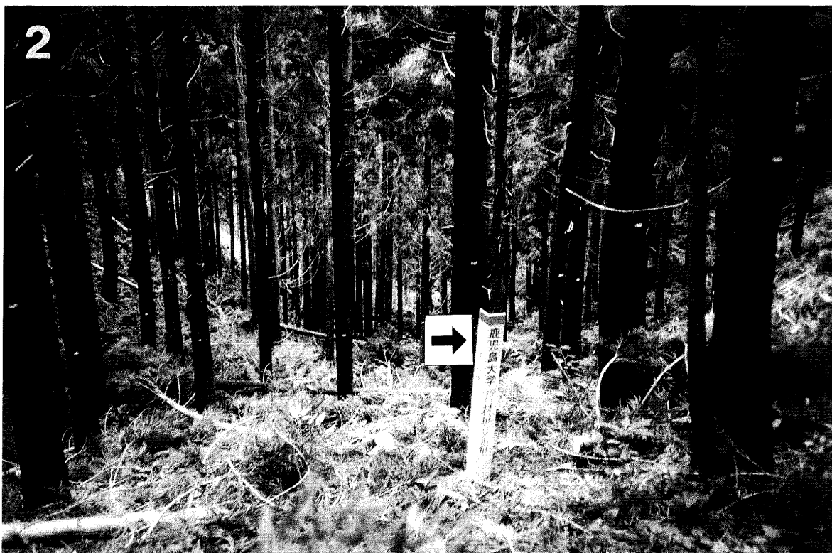
写真 1, 2 間伐前 (上) と間伐後 (下) の林相 標柱 (矢印) 円形プロットを示す