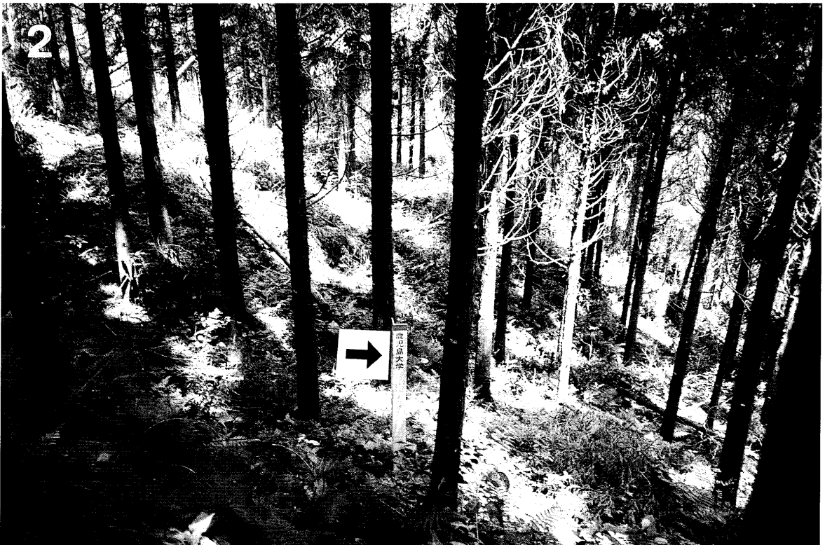
写真1, 2 間伐前(上)と間伐後(下)の林相 標柱(矢印)円形プロットを示す