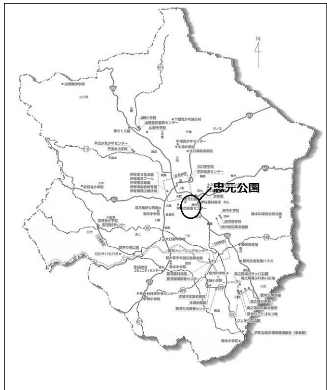
図2：忠元公園の位置図（伊佐市ホームページに掲載された伊佐市全図に基づき、著者作成）

伊佐市の観光については、曾木の滝公園と忠元公園がその代表的な観光地として上げられている。伊佐市は鹿児島県内で多く見られる温泉観光地ではなく、また、JRが直接繋がっていないため、伊佐市の観光形態は、収益の少ない「日帰り方」とも言える。このような状況の中で、忠元公園は伊佐市の市民公園であるとともに、重要な観光資源の一つでもある。