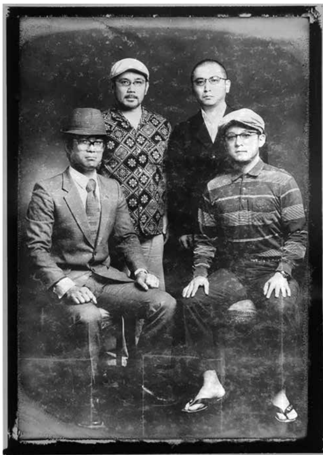
仲間と立ち上げたシマ唄お笑いバンド、 サーモン&ガーリック

当初、アシビは地元ミュージシャンのための環境づくりが目的ではありましたが、オープンして間もなく、東京のプロのミュージシャンからアシビでの出演依頼の問い合わせがありました。これが初めてのソトとのコミュニケーションを図ることとなります。実際本人が奄美に入られ、島のことについて自然・文化・歴史について質問を受けました。私自身、何一つしっかり答えることができず、まし