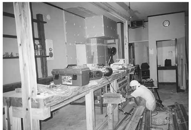
ロードハウス・アシビのオープン5日前の様子。オープン1日前には、先輩・後輩50名くらいが加勢に来てくれた