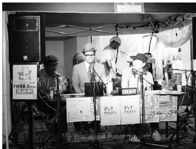
島にもしラジオがあったら・・・ イベントでの模擬パフォーマンス

島内でのメディアといえば、もちろんテレビ・ラジオ等、約 380 Km離れた県本土からの放送を通しソトの情報を受信できます。そのような一方向で雨のように降り注ぐような形でなく、井戸や泉のようにウチから湧き出るものを自ら浴びるような島の情報の循環・感化のような日常スタイルが構築する伝達手段は？と模索している中で「ラジオ」という音声媒体での情報伝達がよいのではないかと気づきます。新聞・本・インターネット等の能動的媒体には意識的に触れますが、テレビはじめラジオなど受動的媒体は無意識に触れることを考えると、これまで無意識に劣等感が生まれてしまった状況において、アイデンティティを育むにはその無意識に改めて、島のモノゴトによる情報や価値