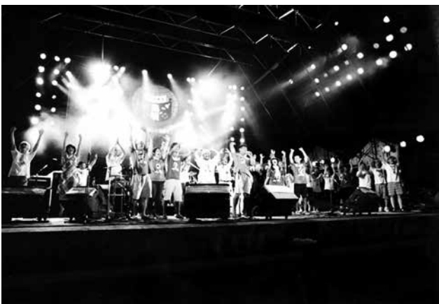
奄美群島日本復帰50周年イベント 夜ネヤ島ンチュ、リスペクチュ！奄美群島青年団による万歳

2002年1月東京渋谷クアトロで夜ネヤ～を開催企画しました。初めての東京での開催です。知り得る在京の奄美出身の先輩・後輩・同級生にイベント開催を呼びかけます。