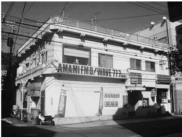
2階にあまみエフエムのスタジオ兼事務所、 1階はロードハウス・アシビ

その後、ハード面では地元の唯一の電波業務関わる株式会社 奄美通信システムなどの強力な技術サポート、そしてスタジオ・事務所工事と放送制作などのソフト面と資金では私が経営するイベント会社、有限会社アーマイナープロジェクトがサポート、更には地元の500名近くのサポーター会員によって、2007年5月に「島ツチュの島ツチュによる島ツチュのための島ラジオ」というキャッチコピーを掲げ、あまみエフエム ディ！ウェイヴが九州総合通信局管内での離島初として開局しました。スタッフは未経験の島興しに賛同する30代、5名で（現在11名）スタートしました。放送内容は、南海日日新聞・奄美新聞など地元二紙の記事提供による島のニュースや天気予報、空路・航路、お悔やみの案内、島口格言や島口ニュースなど島に特化した放送を行っています。