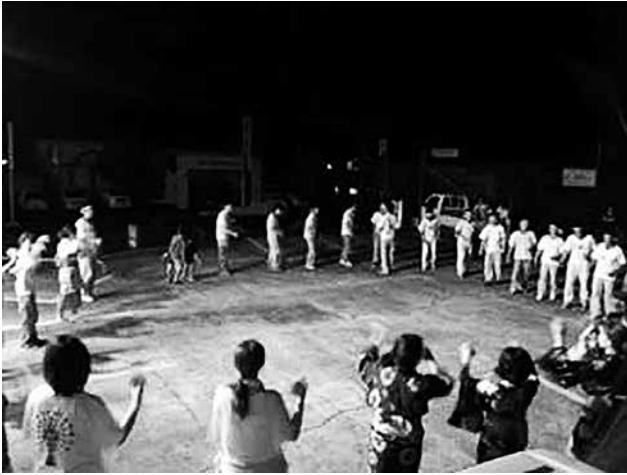
集落での青年団活動 ～八月踊りの練習風景

次世代の子どもたちにも影響を与えます。島を出ていくまで彼らもその役割を果たす時に気付き、島に戻らねばという帰巢本能に駆られるのではないかと思います。ある意味、その集落・コミュニティでの役割がアイデンティティを形成する一つの要素といえます。しかしながら、その青年団のような価値観・活動を対外的に伝える術が少なく、また伝えるべき対象である大人と子どもをつなぐ橋渡し世代である20代前半の多くが、就職・進学と島外に出ています。その感化すべき対象である内地へ出て行った若い世代へ向けて、東京でのイベント開催を目論みます。