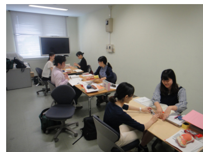
大学院生への実践教育