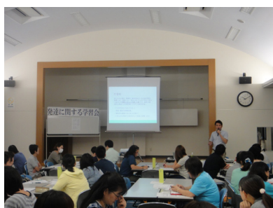
地域での支援活動

2013年度まで地域支援プロジェクトで行ってきた、遠隔地・離島支援を含んだユニークな地域貢献活動が評価され、2014年度からは本研究科の重要な教育研究事業として位置付けられました。このようにして地域支援プロジェクトは、臨床心理学を基盤とした地域支援の臨床実践と実務教育の架橋につながる全ての地域支援活動を含み込む形で発展的に継続しています。