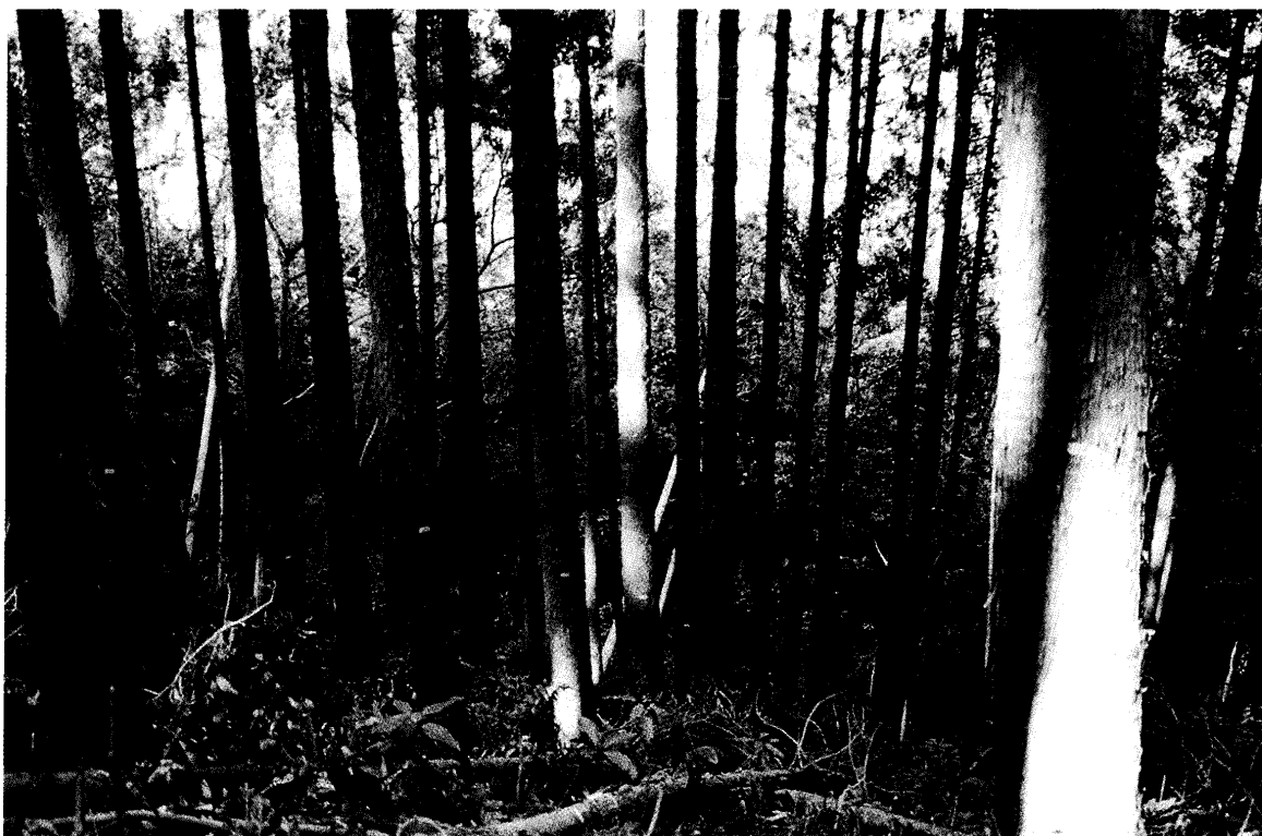
写真-1, 2. 除伐実行前(写真-1)と実行後(写真-2)の林相。 矢印は円形プロットを示す。